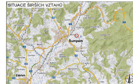
SITUACE ŠIRŠÍCH VZTAHŮ